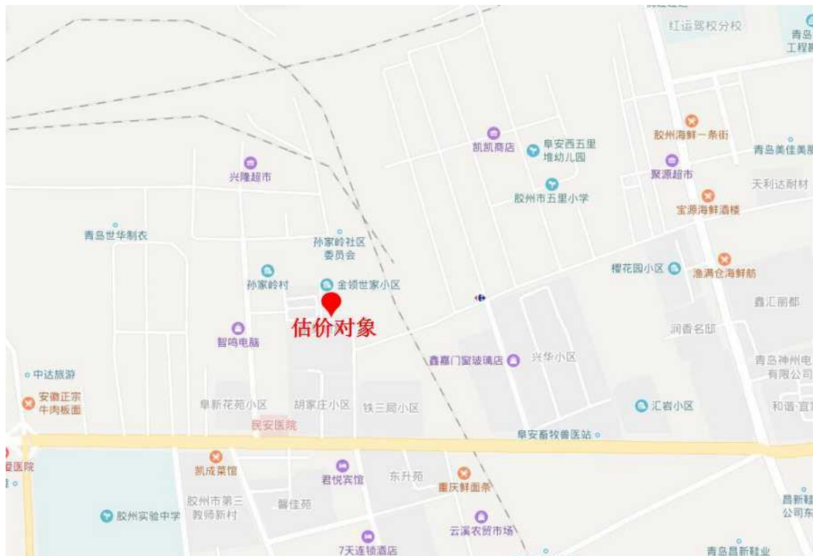
估价对象区位状况图

的省级经济技术开发区，加强了李哥庄、胶东、北关、中云、南关、阜安、马店等重点乡镇的工业园区建设，新设立了胶州湾工业园和大沽河工业园，积极为外商创造良好的投资环境，一批新技术项目和大财团、大公司、大商社落户胶州；个体私营经济日趋活跃，成为近几年全市最有生机、最有潜力的经济生长点。