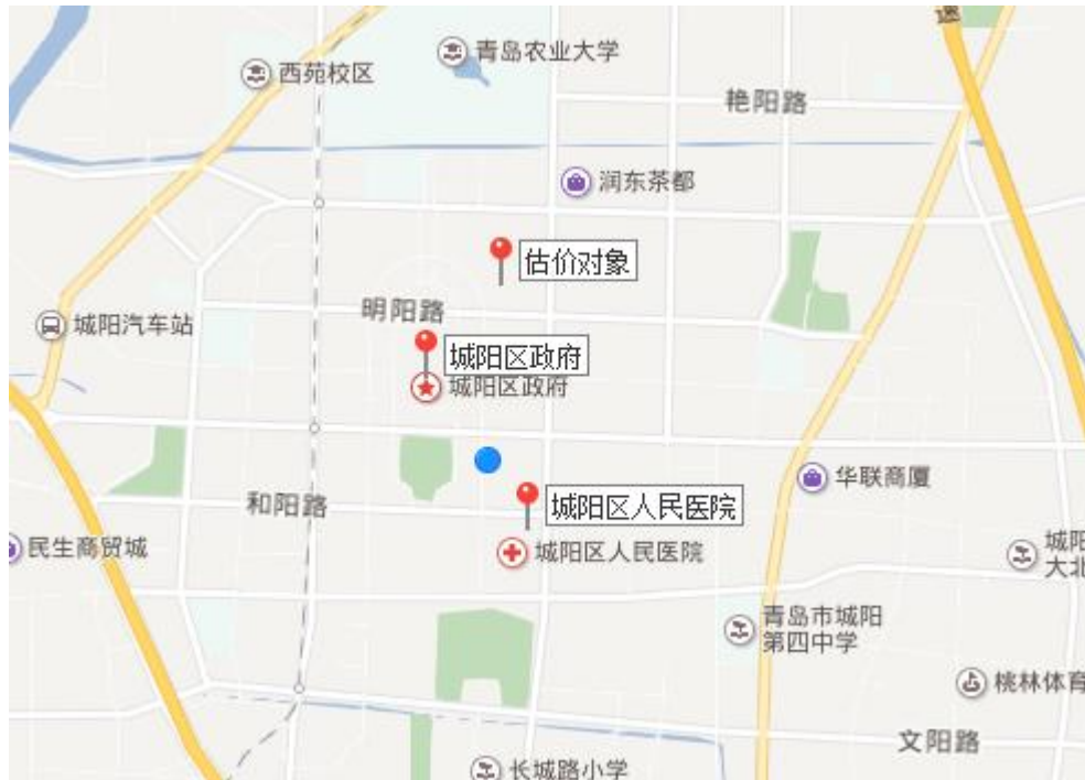
估价对象区位状况图