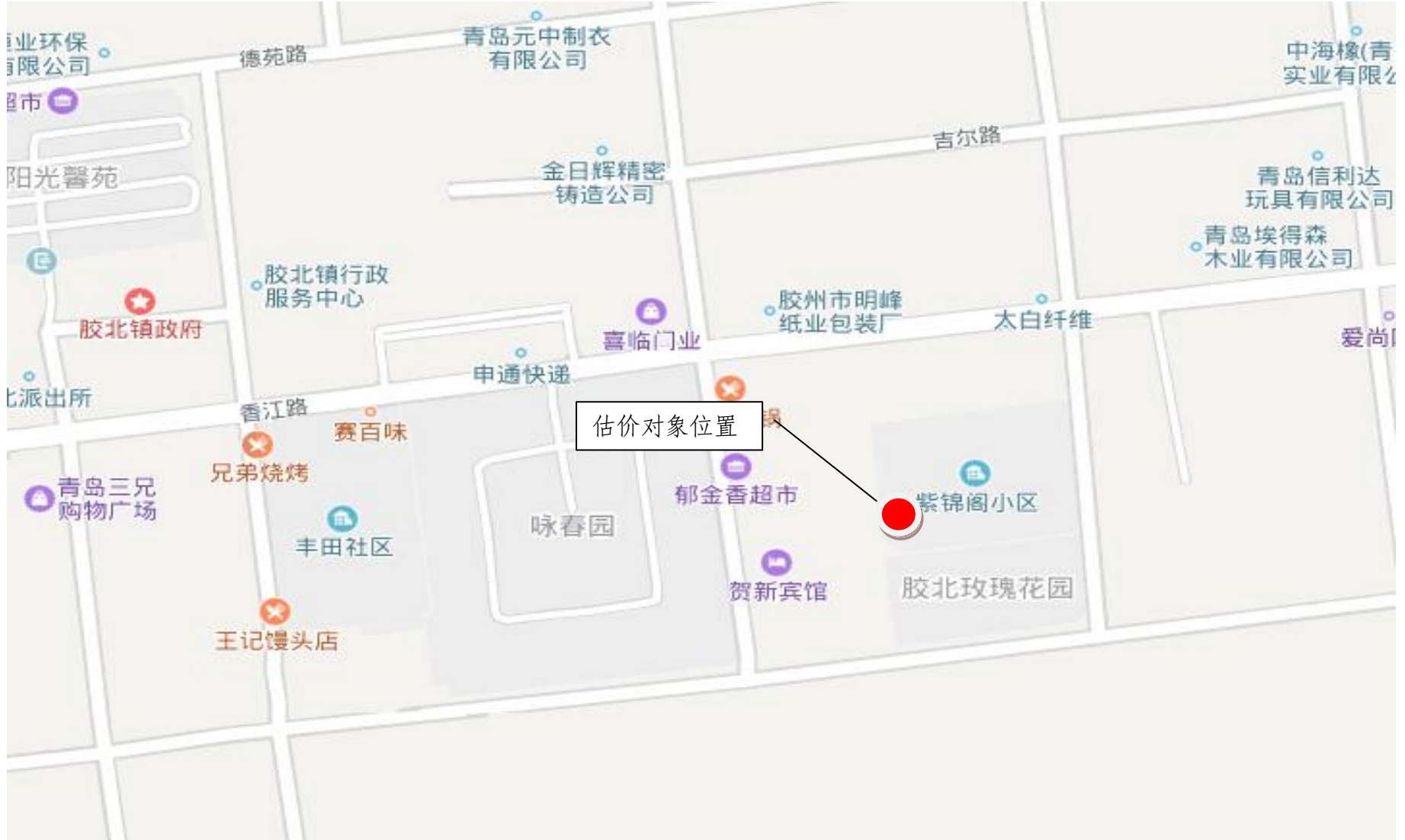
估价对象区域位置图