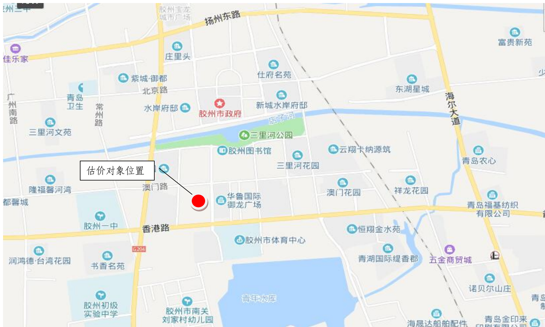
估价对象区域位置