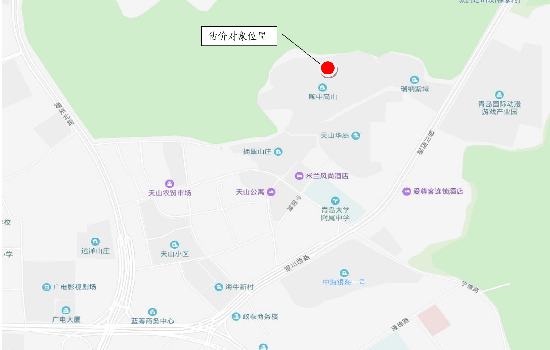
估价对象区域位置图