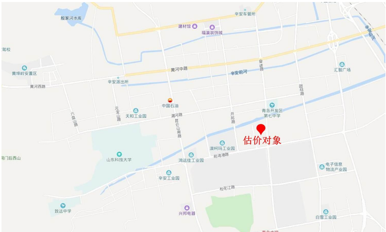
估价对象区位状况图

新区文化事业蓬勃发展，科教实力雄厚。黄岛区内有中国石油大学(华东)、山东科技大学，青岛理工大学、北影分校青岛创意媒体学院等多所大中专院校。中国科学院青岛科教园、复旦大学青岛研究院、清华大学美术学院、哈尔滨工程大学青岛校区等国内知名高校和科研院所也将陆续落户此处。