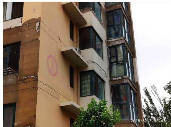
估价对象所在楼座