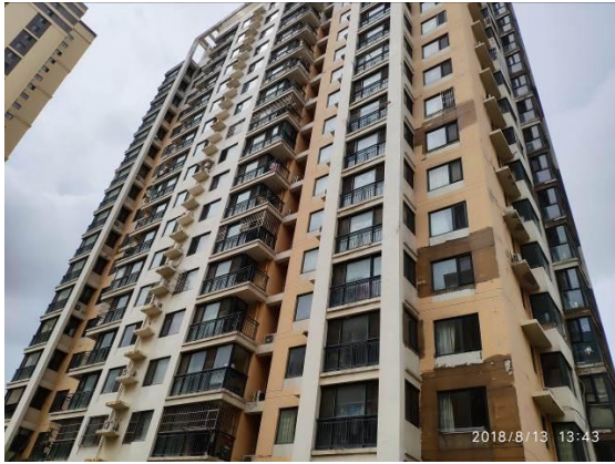
估价对象所在楼座外立面