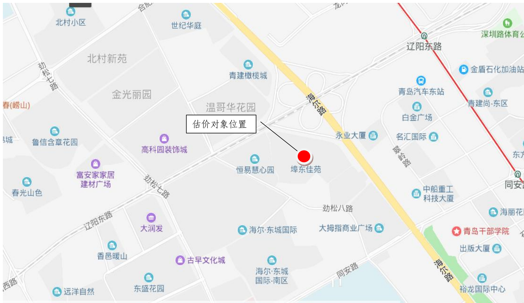
估价对象区域位置