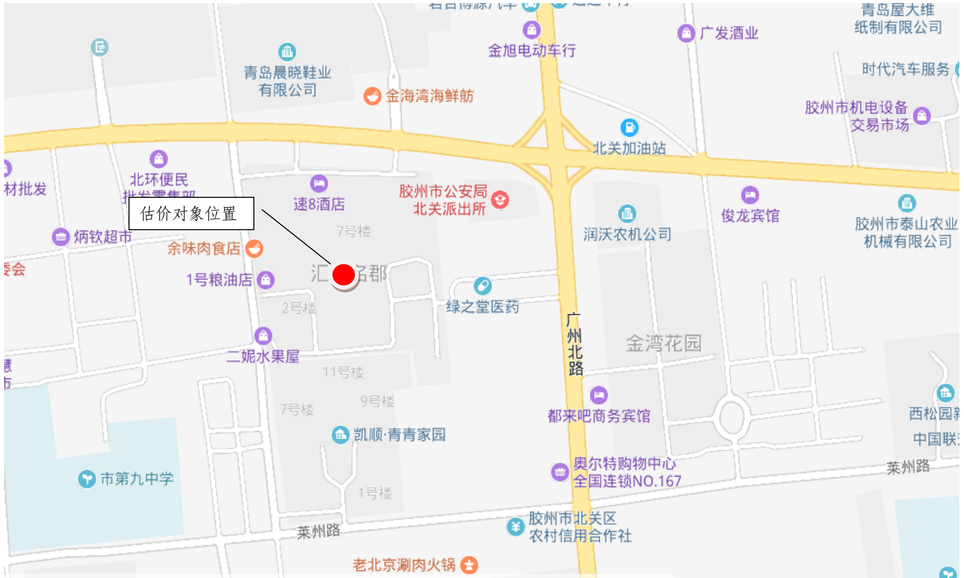
估价对象区域位置