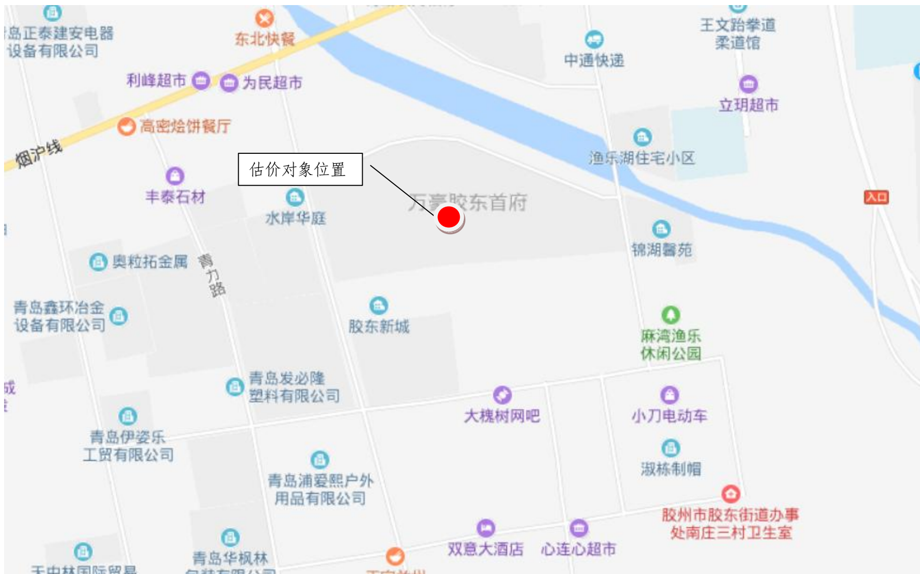
估价对象区域位置