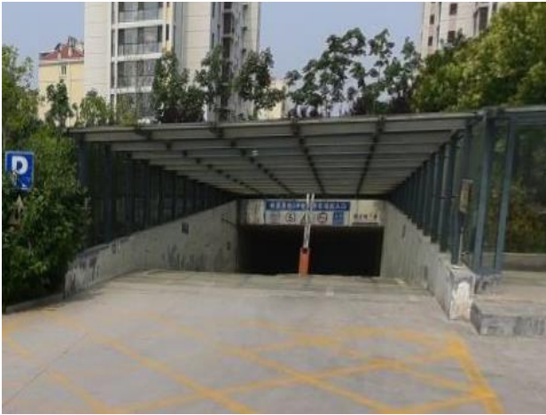
地下停车场出入口