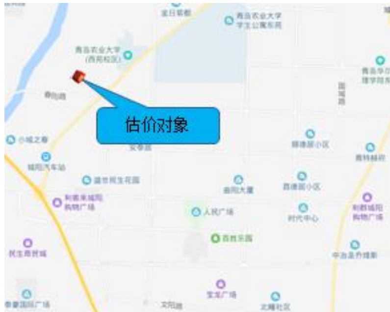
估价对象区位状况图