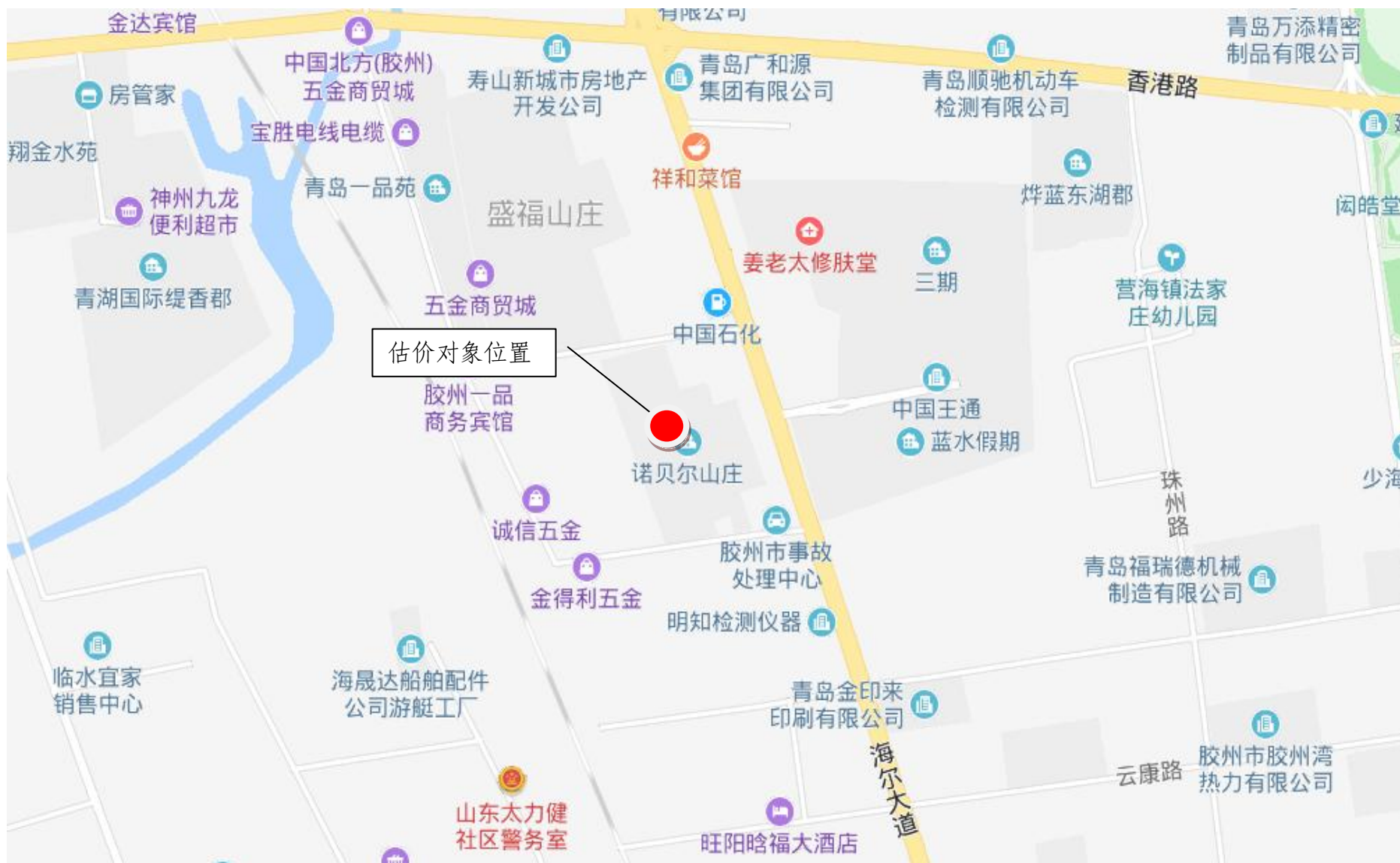
估价对象区域位置