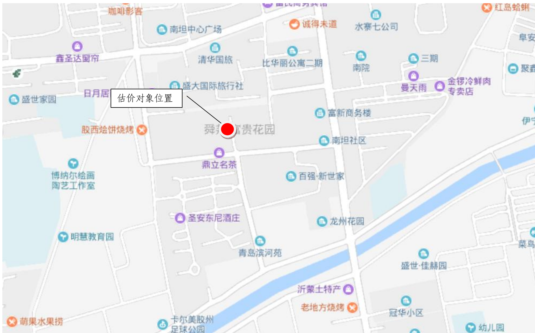
估价对象区域位置