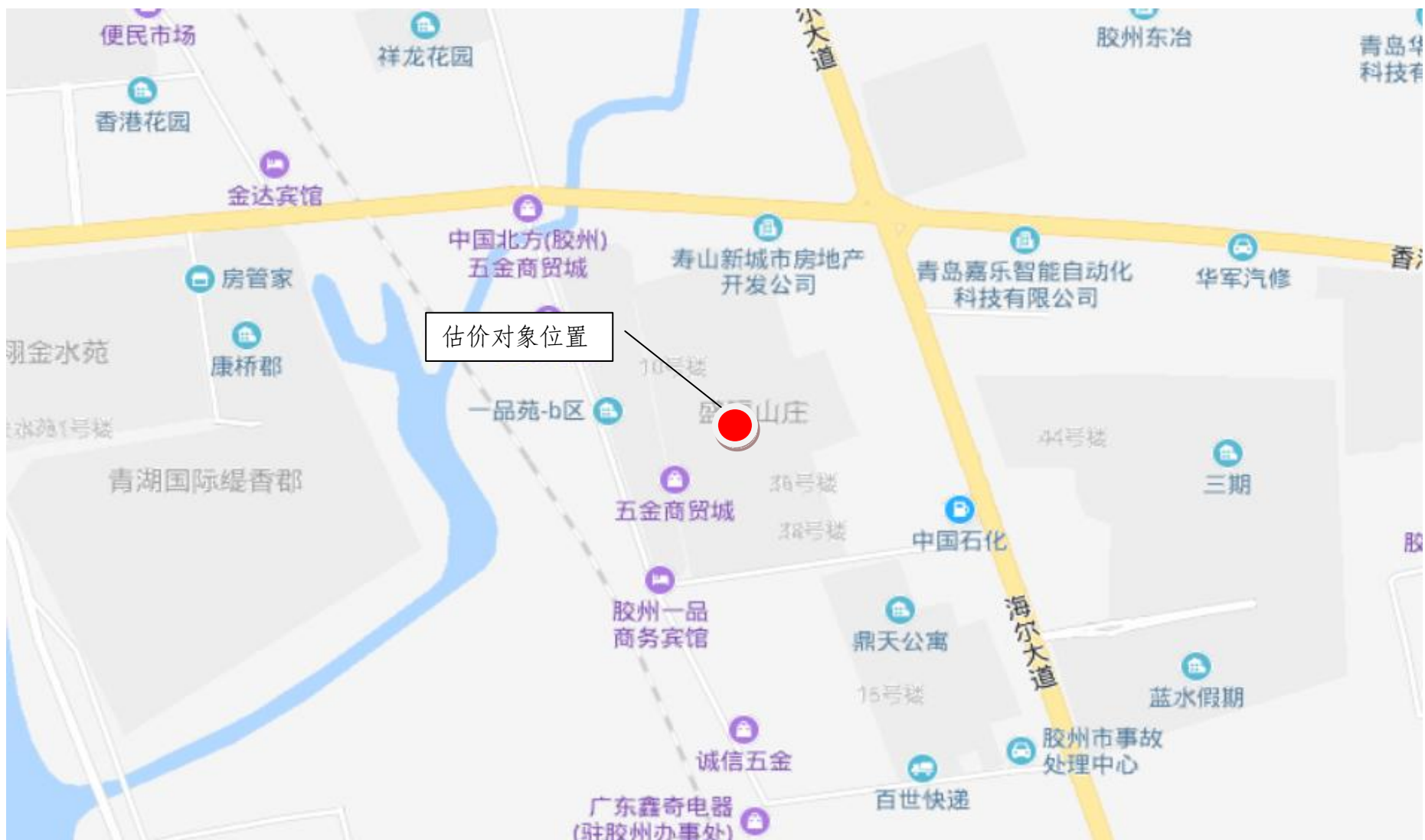
估价对象区域位置